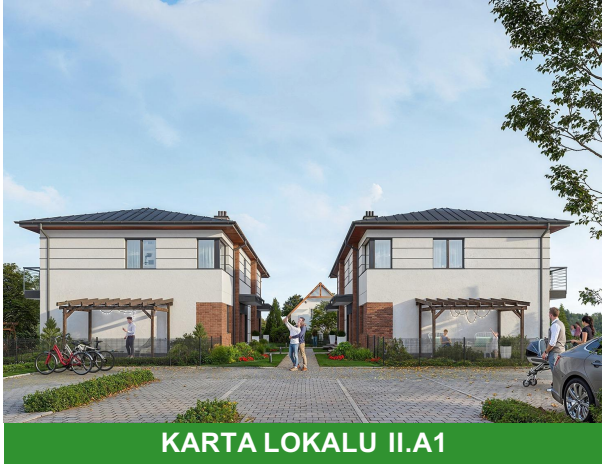
KARTA LOKALU II.A1